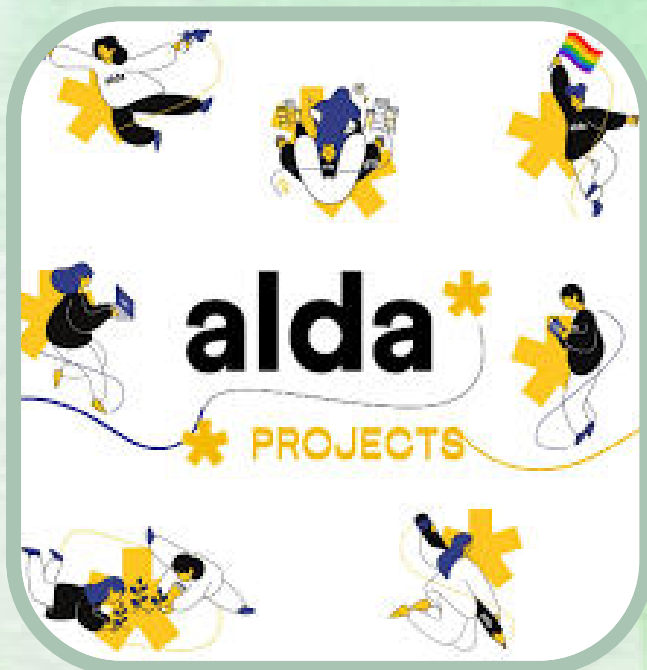
ALDA – Association Européenne pour la Démocratie Locale (Francia)