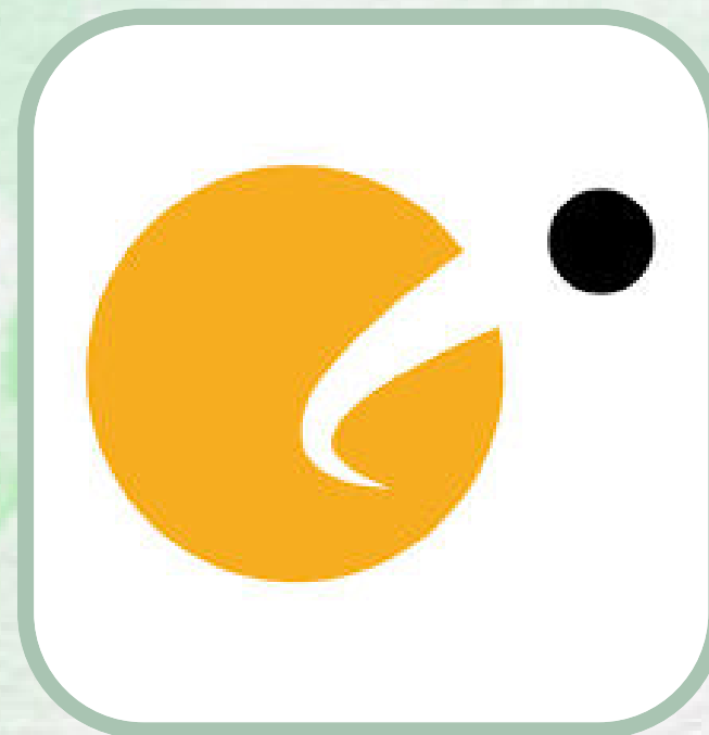
Fundacja Merkury (Polonia)